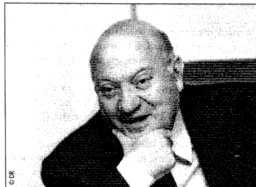
André Santini, secrétaire d'Etat à la Fonction publique.

E.W. : Les sondages sur la Fonction publique montrent régulièrement deux choses : les Français